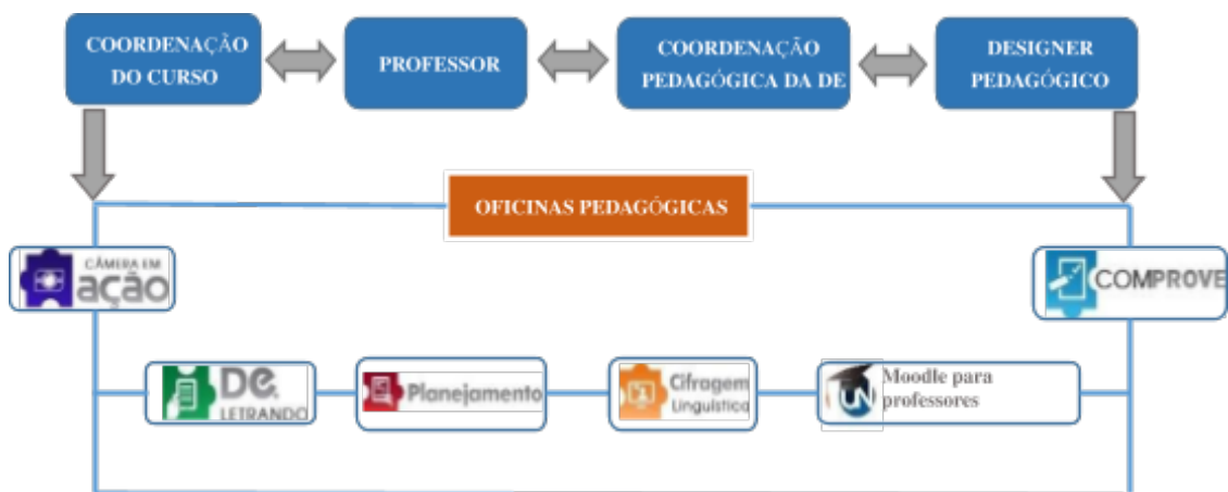
Figura 3 – Acompanhamento do Professor no Setor Design Educacional/ UEMAnet